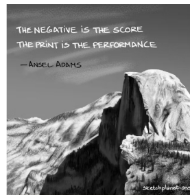
Prints and performances